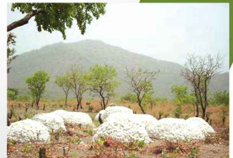
Coton récolté dans la région de Pala (Tchad)