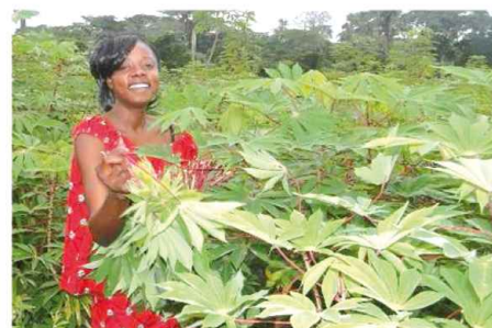
Collecte de feuilles de Manioc dans un champ (RCA)

3 La Stratégie du PRASAC est axée sur le Partenariat multi acteur, le partage des tâches et la mutualisation des moyens. Ce partenariat est notamment développé avec les Systèmes Nationaux de Recherche Agricole (SNRA) des pays d'Afrique Centrale, le point d'entrée étant l'Institut de recherche agricole du pays.