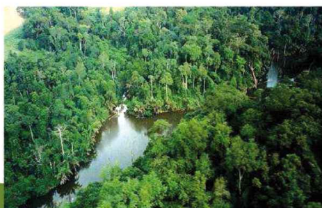
Vue aérienne de la forêt dans le bassin du Congo