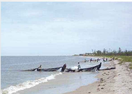
Pêcheurs remontant les filets dans la région de Kribi (Cameroun)

2 Les Domaines d'activités du PRASAC sont les productions agro-sylvopastorales, les ressources halieutiques, la sécurité alimentaire et nutritionnelle, l'environnement et le bien-être des populations de la sous-région. Ils sont développés dans trois (3) axes de recherche comprenant (i) Santé Humaine et Animale, (ii) Sécurité Alimentaire, et (iii) Forêt, Environnement et Biodiversité.