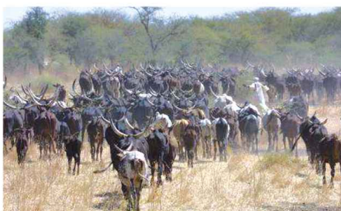
Troupeau de bovins dans les savanes soudanaises du Tchad