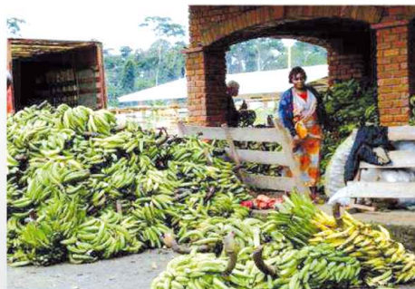
Marché régional à la frontière du Cameroun, du Gabon et de la Guinée Equatoriale